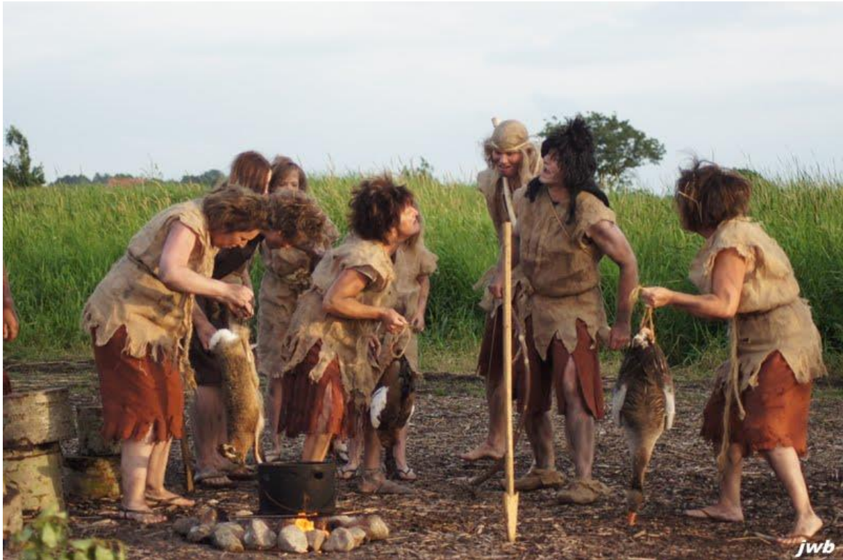
Tijd is in sirkel, openluchtspel gespeeld in 2012 in Bantega

Er zijn in onze gemeente veel verenigingen en organisaties die zich op verschillende plekken laten zien en horen. Gaat het om toneel- en openluchtspelverenigingen, dan is het Fries vaak de taal waarin de voorstelling gespeeld wordt. Er zijn 11 toneelverenigingen uit De Fryske Marren die aangesloten zijn bij de stichting Amateurtoneel Fryslân (STAF). Deze organisatie ondersteunt de verenigingen door een jaarlijkse toneelwedstrijd, verenigingen in contact te brengen met de schrijvers van toneelstukken, regisseurs enz. Ook het jeugdtonaal wordt gestimuleerd. Gezien het plezier dat spelers en publiek aan deze culturele activiteiten beleven en het belang dat het heeft voor het levend houden van de Friese taal, is het belangrijk dit als gemeente te steunen. Daarvoor kunnen ook de mogelijkheden van Leeuwarden Culturele Hoofdstad 2018 en de Gebiedsagenda van de Provincie onderzocht worden.